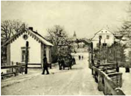
↑ Pohled z dřevěného mostu na Motošín v zimě 1892/1893. Vlevo domek, kde se vybíralo mostní mýto (zbořen 1904).

↗ Dřevěný most přes Bečvu někdy na přelomu 19. a 20. století.