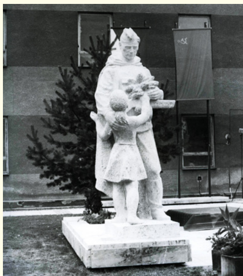
↑ Pomník se pak na několik let stal místem konání oficiálních oslav politického režimu.