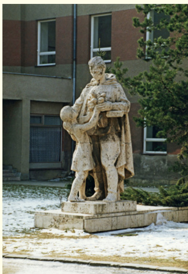
↑ Sousoší zůstalo na Školním náměstí do 16. srpna 1994, kdy bylo po dlouhých diskuzích přemístěno na Tř. ČSA.