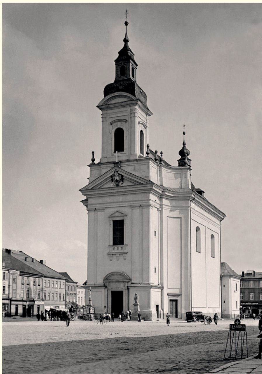
↑ Monumentální farní kostel Stěti sv. Jana Křtitele byl na hranickém náměstí vystavěn v letech 1754–1764, na fotografii z doby kolem roku 1930 právě vidíme pohřeb vypravovaný z kostela. Kromě kočáru a bicyklu jsou na ploše náměstí rozmístěny pouze jeden motocykl a jeden automobil.