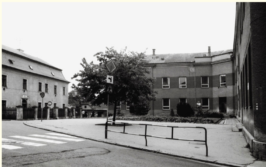
↑ Záběr Školního náměstí nedlouho po odstranění pomníku Vítání Rudé armády. Uplynulo dvacet pět let a na rok 2020 je tu plánováno odhalení nového pomníku Tomáše Masaryka, snad vydrží dlouho. Fasáda základní umělecké školy prošla v roce 2017 působivou proměnou.