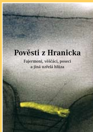
Tomáš Pospěch (ed.) POVĚSTI Z HRANICKA 2007

Dvoustpadesátistránková kniha s podtitulem Fajfermoni, věščíci, poseci a jiná uzřelá hlúza obsahuje na sedmdesát lidových pověstí z Hranicka. Barevné ilustrace Nory Procházkové.