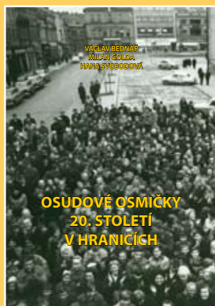
V. Bednář • M. Golda • H. Svobodová OSUDOVÉ OSMÍČKY 20. STOLETÍ V HRANICÍCH 2008

Dvoustpadesátistránková kniha s podtitulem Fajfermoni, věščíci, poseci a jiná uzřelá hlúza obsahuje na sedmdesát lidových pověstí z Hranicka. Barevné ilustrace Nory Procházkové.