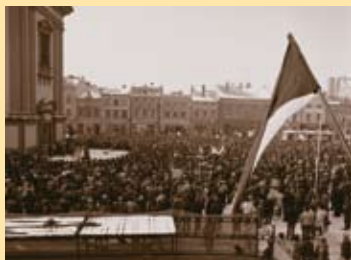
Generální stávka, 27. listopadu 1989.