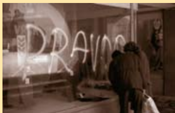
Vedle skupiny lidí, která se v Hranicích chopila značky OF, existovala řada dalších individuálních či skupinových aktivit, jež se snažily „burcovat veřejné mínění“. Jednou z nich byla např. výloha obchodu s potravinami na tehdejšímu Revolučnímu náměstí, která se proměnila v informační nástěnku. Jiným druhem protestu byl nápis PRAVA přes výlohu kombinující oslavu VŘSR s módními oděvy na Horním podloubí.