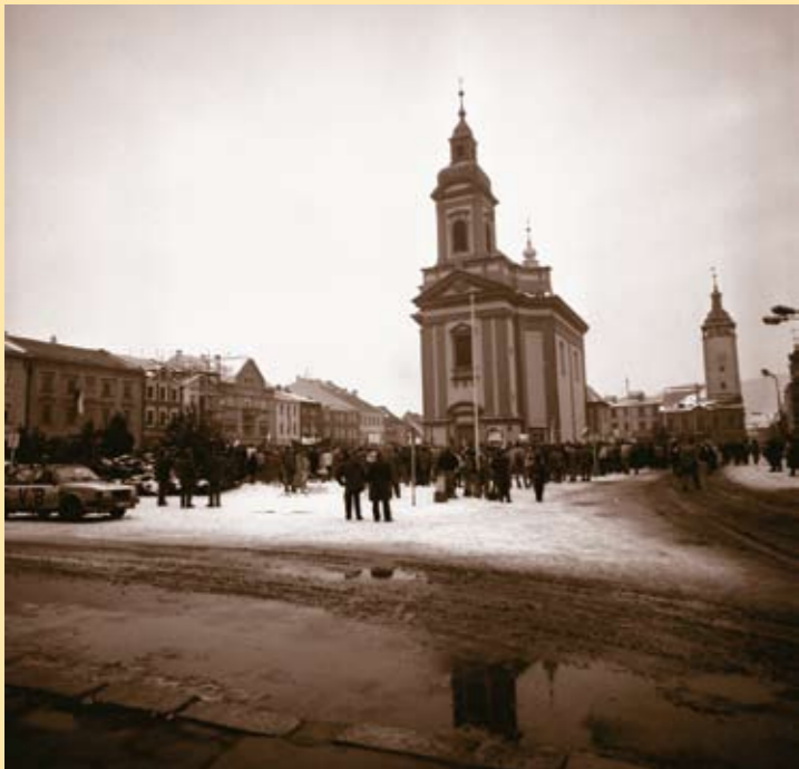
Generální stávk, 27. listopadu 1989.