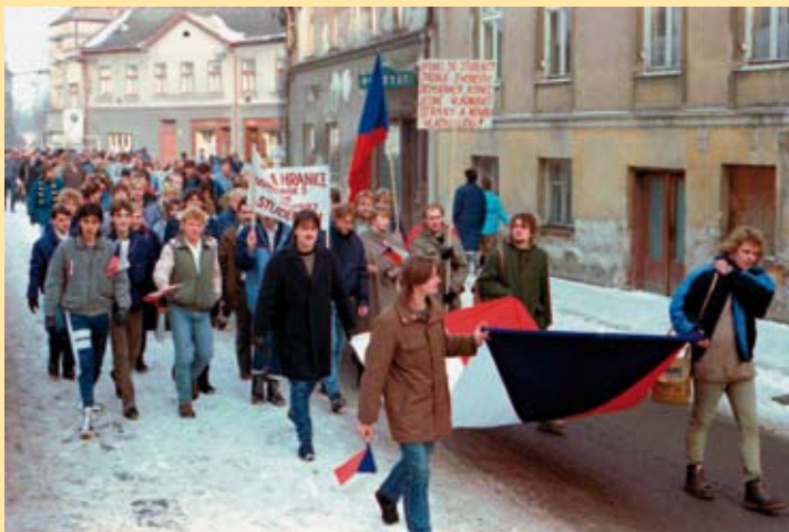
Zaměstnanci Sigmy Hranice směřují Jiráskovou ulicí na shromáždění u příležitosti generální stávkový, 27. listopadu 1989.