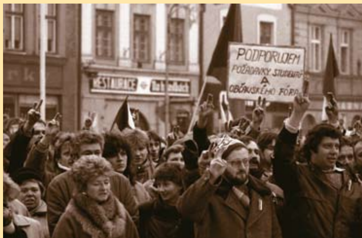
Shromáždění v době generální stávky, 27. listopadu 1989. ■ Foto: Roman Kubíček

ÚVOD Surové rozehnutí demonstrace, k níž došlo v pátek 17. listopadu 1989 na Národní třídě, odstartovalo pád socialistického totalitního režimu v tehdejší Československu. Vývoj ve větších i menších městech v hlavních obrysech kopíroval postup událostí, k nimž docházelo v Praze, vždyť také legitimita místních Občanských fór vyplývala z legitimacy pražského OF. V detailech byl však místní vývoj pokaždé jiný. ■ Tento text má být stručným ohlédnutím za prvním rokem společenské proměny v Hranicích. Příběh začíná listopadem 1989 a končí o rok později svobodnými komunálními volbami, prvními po čtyřech desetiletích manifestačních voleb, které nabízely jedinou volební kandidátku.