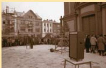
Generální stávka na náměstí, 27. listopadu 1989.